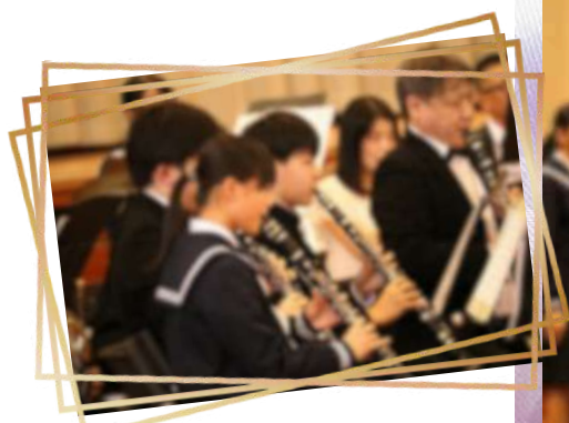
市民吹奏楽団 & 吉中吹奏楽部 合同演奏