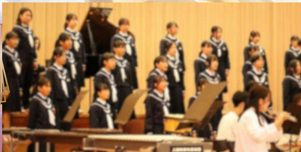
全校合唱「夏は来ぬ」 & 市民吹奏楽団木管五重奏