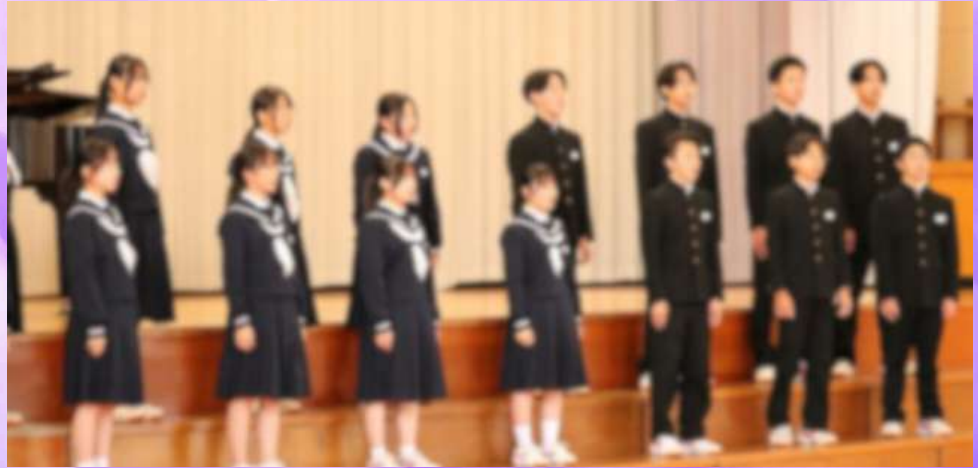
3年生「旅立ちの時～Asian Dream Song～」