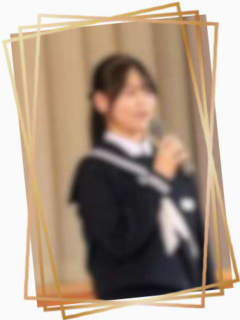
実行委員長のあいさつ

10月18日（土）に、来賓や保護者、地域の皆様をお招きして、音楽祭を開催しました。10月に入り、校舎のあちこちで歌声が響くようになり、直前には放課後の時間も練習に充て、クラスみんなで一生懸命練習してきました。指揮や伴奏を担当した生徒の中には、昼休みや早朝の時間を使って練習していた生徒もいます。その練習の成果が十分に発揮され、どの学年も美しい合唱を披露することができました。